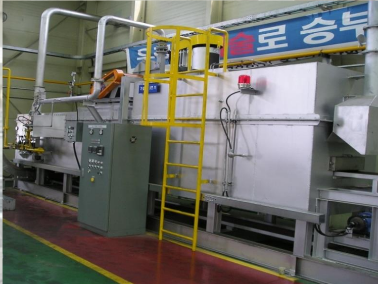
AL 가열로 후성정공㈜