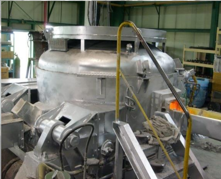
AL 유지로 후성정공㈜