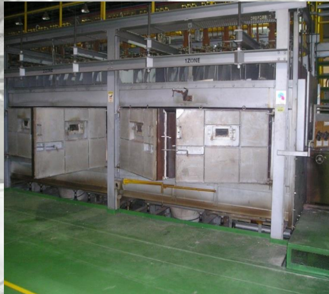
Glass Heating Furnace 코리아오토글라스㈜