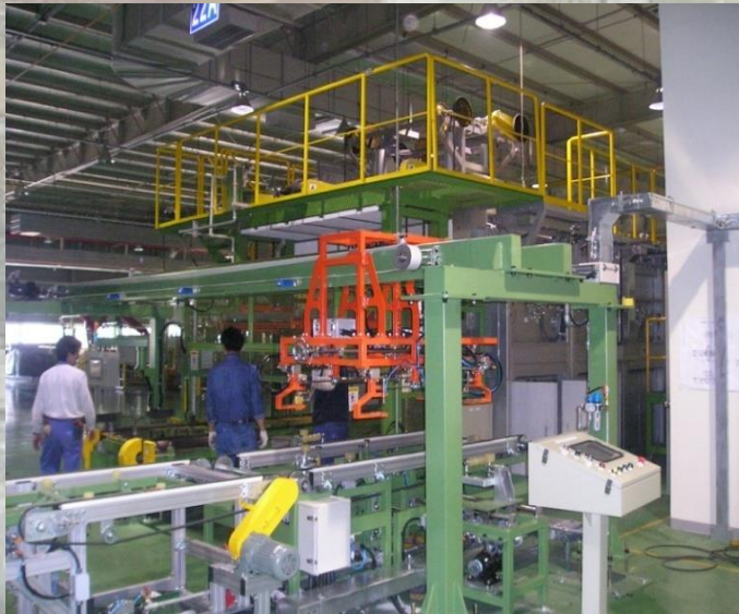
Glass Bending Furnace 코리아오토글라스㈜